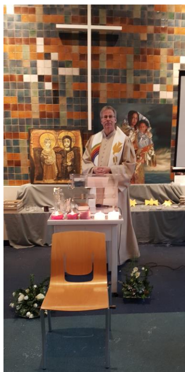
Bij de doorgaande viering in de Bethelkerk, Den Haag