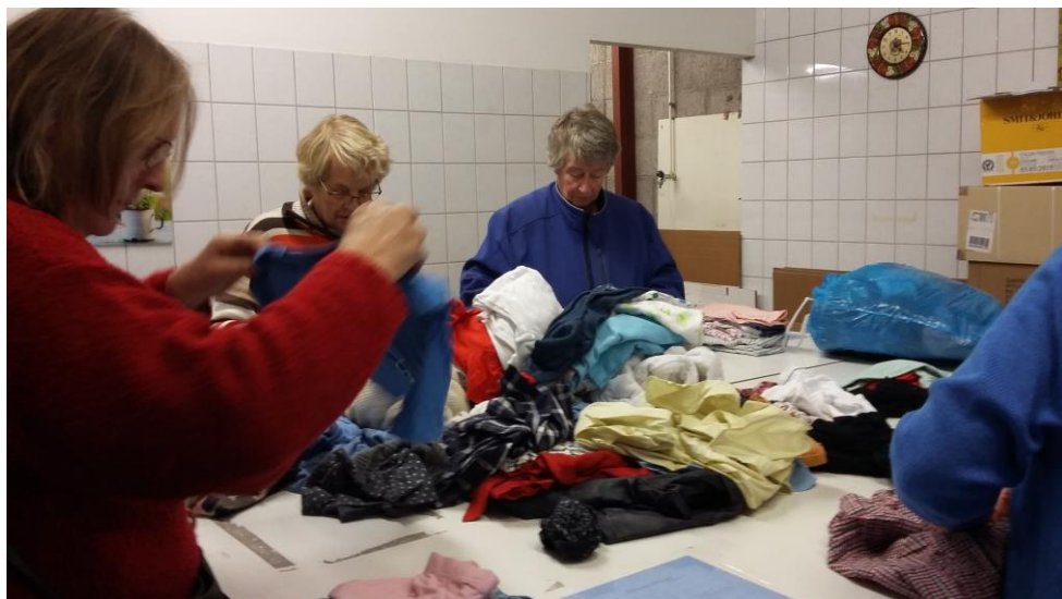
bij het artikel over Clothing4U in de rubriek Van de diaconie